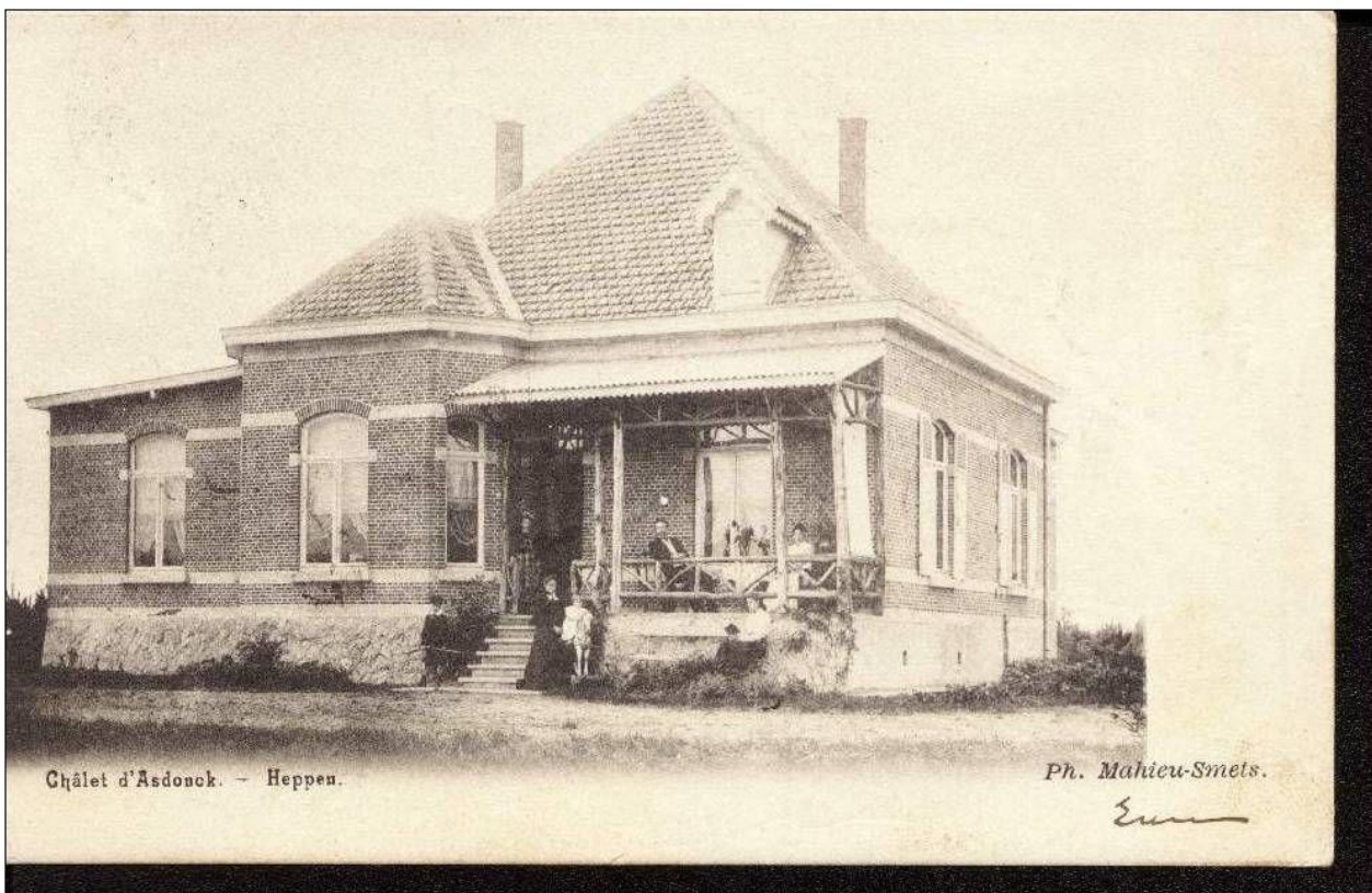
Chalet d'Asdonck. - Heppen.

Zowel in Ham als in Heppen bestaat een Asdonkstraat die naar de Asdonk leidt, met dit verschil dat de Asdonckstraat in Heppen met "ck" wordt geschreven, waarschijnlijk vernoemd naar de Koninklijke villa. De niet verharde Asdonkstraat in Oostham gaat noord-oostwaarts tot aan de Asbeek en verwijst nog naar de originele naam. Aan het begin van die Asdonkstraat in Oostham is een motorracecircuit.